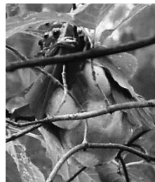
【モリアオガエルの泡の巣】

メスがまずお尻から水を吸収するんだ。そして、その水と一緒に粘液をお尻から出して、足でかき混ぜて作るんだよ。